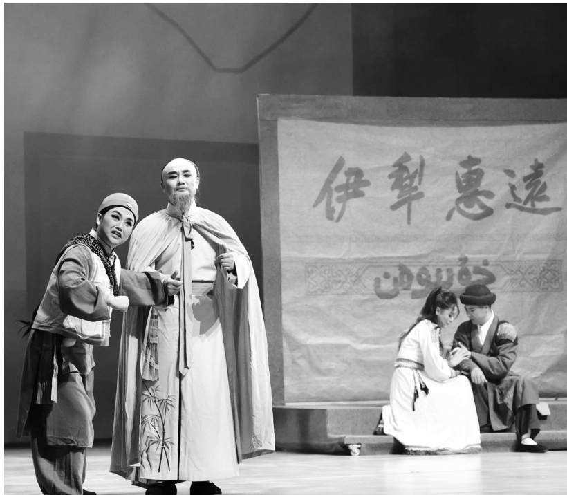
黄梅戏《伊犁月》剧照。