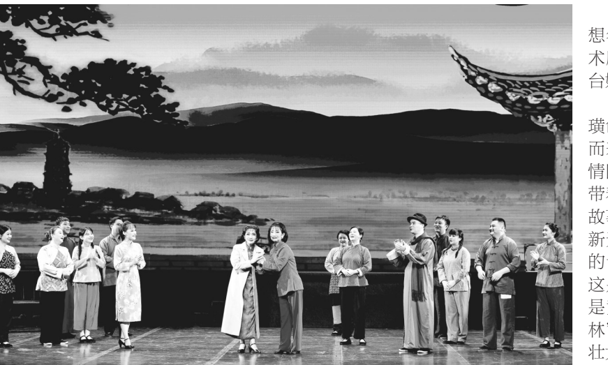
黄梅戏《舞台姐妹》剧照。

本报讯 “谁人不羨大舞台,谁人不想名角当?”9月28日晚,由马鞍山市艺术剧院有限公司带来的原创黄梅戏《舞台姐妹》在市黄梅戏艺术中心精彩上演。