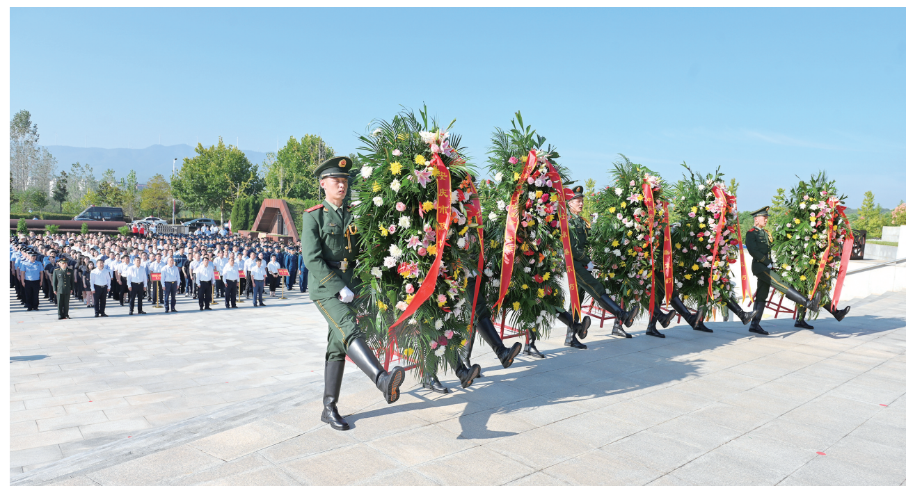
9月30日，我市举行烈士纪念日向烈士敬献花篮仪式。

花篮前驻足凝视，仔细整理花篮缎带。接着，张祥安、张君毅等市领导缓步绕行，瞻仰烈士纪念像。