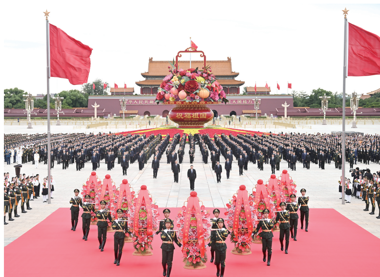
9月30日上午，党和国家领导人习近平、李强、赵乐际、王沪宁、蔡奇、丁薛祥、李希、韩正等来到北京天安门广场，出席烈士纪念日向人民英雄敬献花篮仪式。这是习近平整理花篮上的缎带。