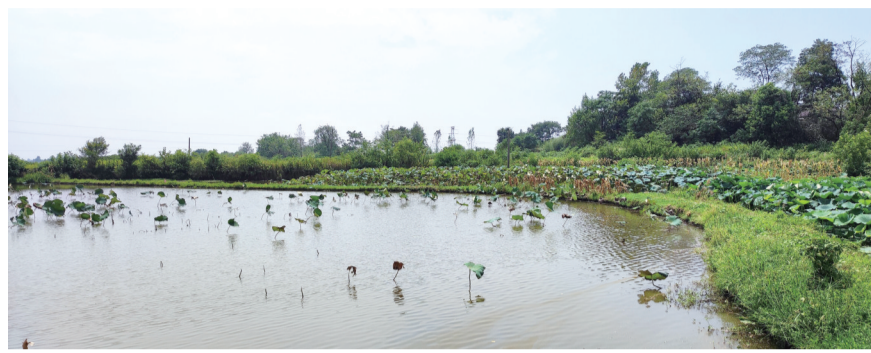
位于怀宁县江镇镇江镇村的彻行农取学校旧址。

这个10月最值得看的剧是哪部呢?不少朋友一定会推荐根据“七一勋章”获得者张桂梅校长真实事迹改编的电视剧《山花烂漫时》。虽说这部剧播完有段时间了,但热度一直不减。