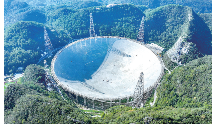
记者11月26日从中国科学院国家天文台获悉,“中国天眼”FAST发现脉冲星数量已突破1000颗,超过同一时期国际其他望远镜发现脉冲星数量的总和。这是9月25日拍摄的“中国天眼”全景(无人机照片,维护保养期间拍摄)。