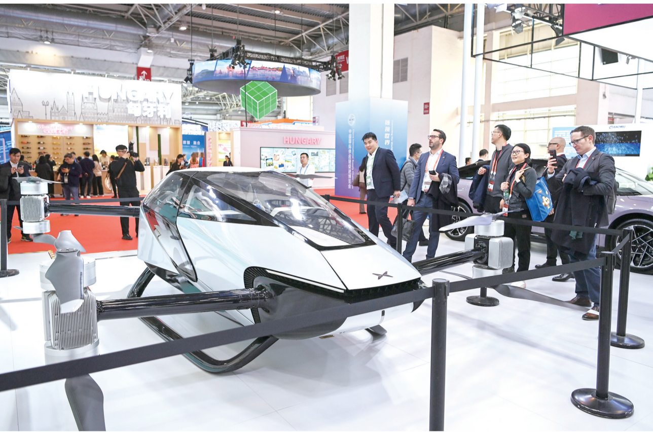
11月26日,人们在第二届中国国际供应链促进博览会小鹏汽车展台参观。当日,由中国贸促会主办的第二届中国国际供应链促进博览会在北京开幕,主题是“链接世界,共创未来”。

第二届中国国际供应链促进博览会(链博会)26日至30日在北京举行,以“链”为纽带,发出“携手成链”“链接世界与未来”的呼声。 “一条马路集一条产业链”“40秒下线一台车”……在当下的中国,供应链变“共赢链”的故事比比皆是。中国供应链产业链稳定强劲,为跨国企业发展提供持久驱动力,为世界经济复苏贡献宝贵确定性。