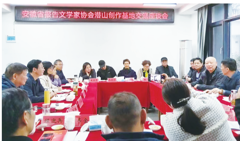
创作交流座谈。

11月21日,安徽省报告文学家协会潜山创作基地的挂牌仪式在潜山市五庙乡举行。安徽省报告文学家协会与马鞍山《作家天地》的作家团队一行十八人,参加了在五庙乡党群服务中心举办的活动。