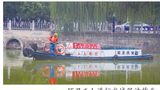
环卫工人进行水域保洁作业。