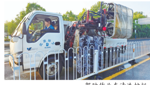
驾驶作业车清洗护栏。