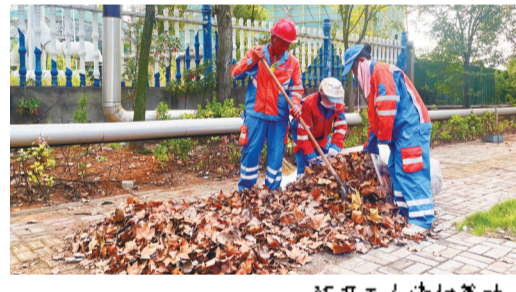
环卫工人清扫落叶。