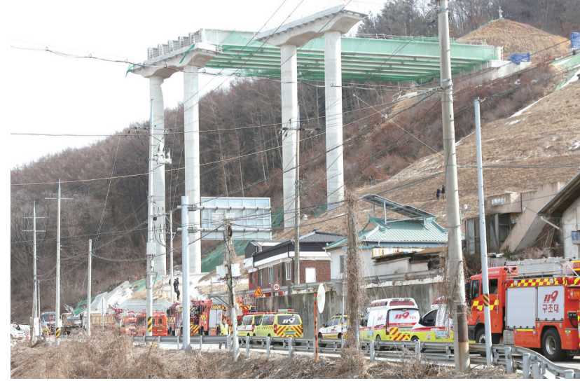
2月25日，救援车辆聚集在位于韩国忠清南道天安市的坍塌事故现场。位于韩国忠清南道天安市的首尔世宗高速公路施工现场25日发生在建桥梁坍塌事故。据韩联社报道，事故已造成3人死亡、5人受伤。