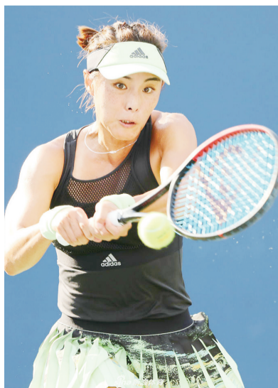
▲中国“一姐”王蔷在比赛中回球▲

对于明年的东京奥运会,王炼表示:“在提前一站完成席位任务后,我们赢得了更多的时间准备奥运会,我们要围绕奥运参赛的重点,突出决赛能力、夺金能力的强化训练。同时要走出去,请进来,请国外的优秀教练、运动员来华讲课、交流,我们各个项目也要化整为零,出国与国外的优秀队伍共同训练,学习国外的优秀训练理念和方法。”(葛柔)