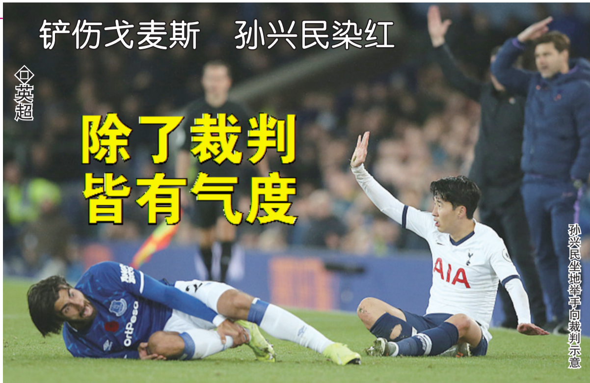
孙兴民倒地举手向裁判示意

北京时间11月4日,在英超足球联赛第11轮的争夺中,托特纳姆热刺队客场被埃弗顿队补时第7分钟的进球扳平比分。比赛中热刺大将孙兴民犯规导致对方球员戈麦斯重伤,韩国人染红离场。