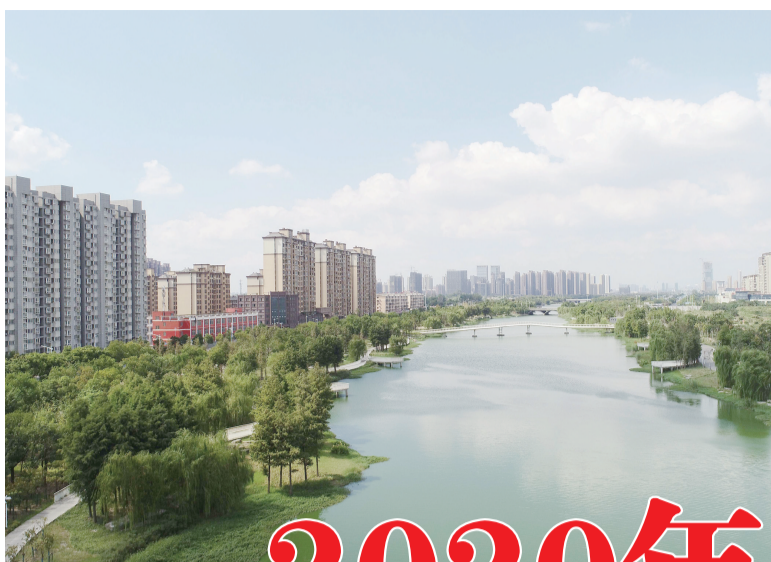
安庆市新闻传媒中心评出

7月,受持续强降水等因素影响,安庆汛情“新老叠加、内外交困”,防汛形势异常严峻。截至7月12日20时,长江汇口站水位22.28米,超警戒水位2.48米,居历史第二位;安庆站水位18.34米,超警戒水位1.64米,居历史第三位。关键时刻,党群连心、干群联手,全市上下拧成一股绳,共同织密防汛网络,筑起一道冲不垮的“钢铁长城”。