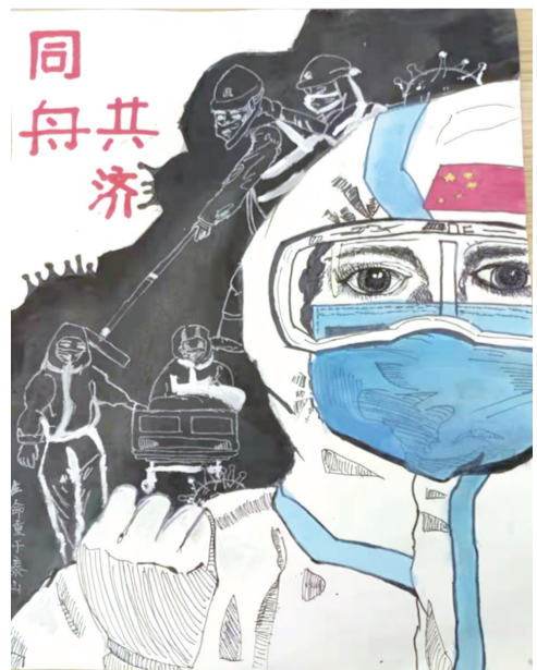
同舟共济 501班 郭若汐 指导老师:何文