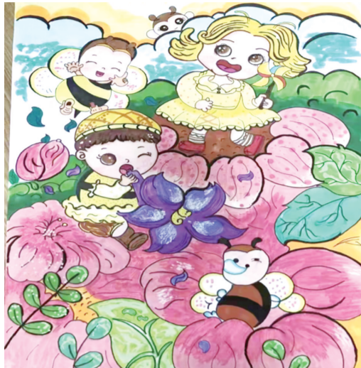
欢乐图 401班 王语梦 指导老师:李海燕