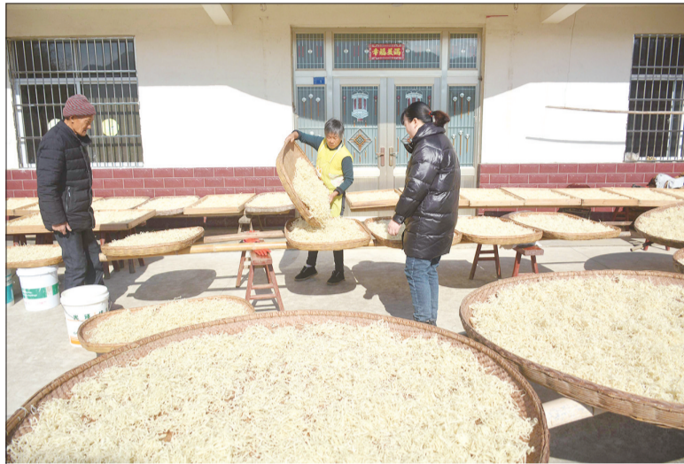
12月5日，在安庆市岳西县田头乡宁河村，村民在自家晒豆粿。“岳西豆粿”历史悠久，是安庆市非物质文化遗产。近年来，每年冬天，田头乡宁河村几乎家家户户用自家种植的黄豆、大米等农作物制作豆粿，山村处处飘散着浓浓的豆粿香味。

“再迟半个小时送来，人可能就没得救了。”经检查，医生发现刘某的血糖值远远低于正常标准，紧急救治后，刘某终于脱离了生命危险，但仍需接受进一步治疗。事后，民警反复叮嘱刘某家属，一定要对刘某多加关心和照料，防止再次发生类似行为。