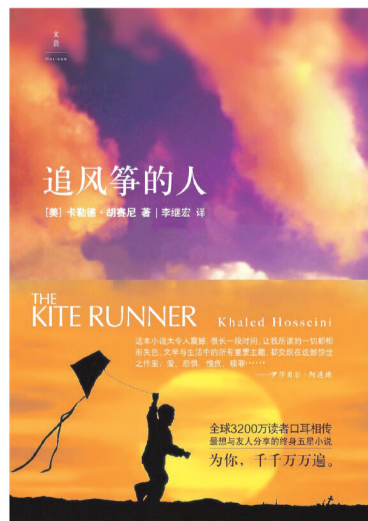
《追风筝的人》 [美]卡勒德·胡赛尼 著 上海人民出版社2018年6月出版