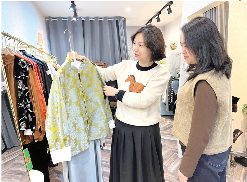
一家商铺内,销售人员正在向顾客展示“新中式”春装。

本报讯(全媒体记者 刘惠子 文/图)春日万物复苏,春装也抓住时机亮相。日前,记者走访发现,“新国风”“新中式”服装正成为宜城春季服装市场的一大亮点,深受市民喜爱。“新中式刺绣穿搭”“为什么年轻人都喜欢新中式”等话题也接连登上热搜。