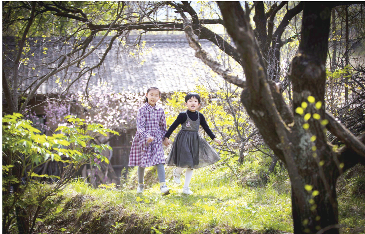
三月的花朵

烧好的河瓷肉，吃起来紧实有嚼劲，带着河水独有的淡鲜。青菜的清甜渗进汤汁里，融着河瓷的鲜，鲜而不腻，越嚼越有味儿。河瓷肉的蛋白质和钙含量很高，