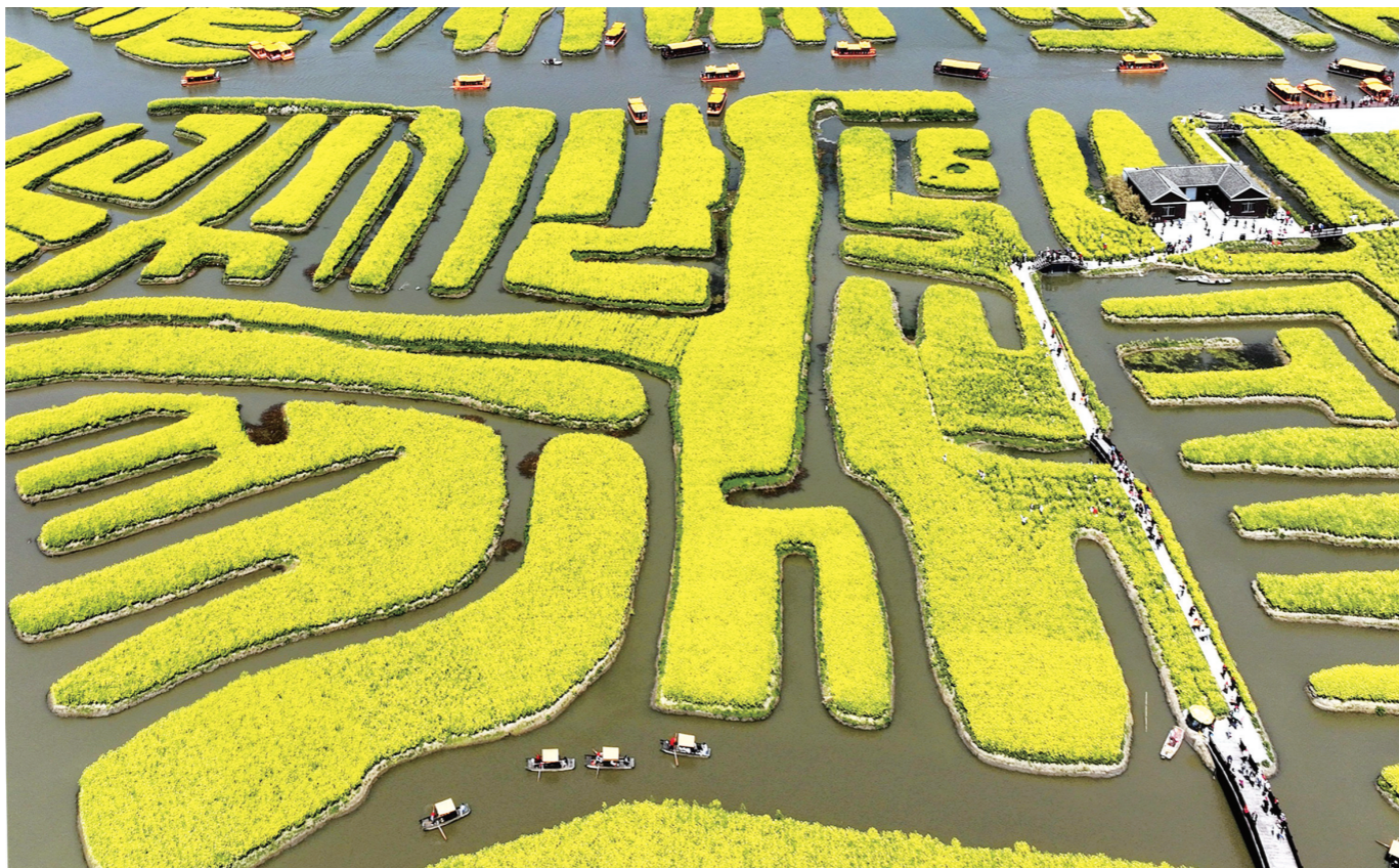
水乡花海

小时候，爱玲在天津常吃鸭舌小萝卜汤，“学会了咬住鸭舌头根上的小扁骨头，往外一抽抽出来，像拔鞋拔。”她俏皮地说：