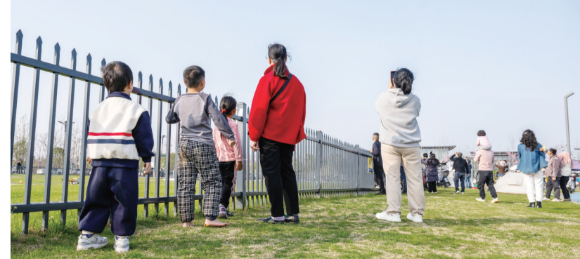
3月21日,游客在武汉未来茶低空文旅产业示范园游览。近日,湖北发布中国光谷科技旅游线路,推出超级工厂线、人工智能线和低空文旅线三大主题科技旅游线路。这些线路依托光谷领先的光电子信息、人工智能等产业优势,将科创与文旅观光融合,方便游客近距离体验。