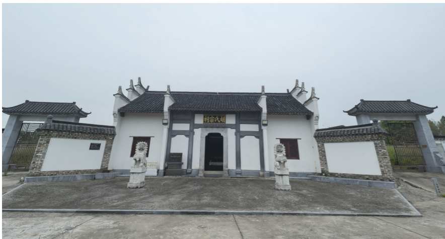
位于望江县高士镇虎山村的虎山胡氏宗祠。

一位退休的从五品武官,有没有可能突然被朝廷起用,任职从二品文官?有的,朋友。其中至少有一位,还出生在安庆的望江县。