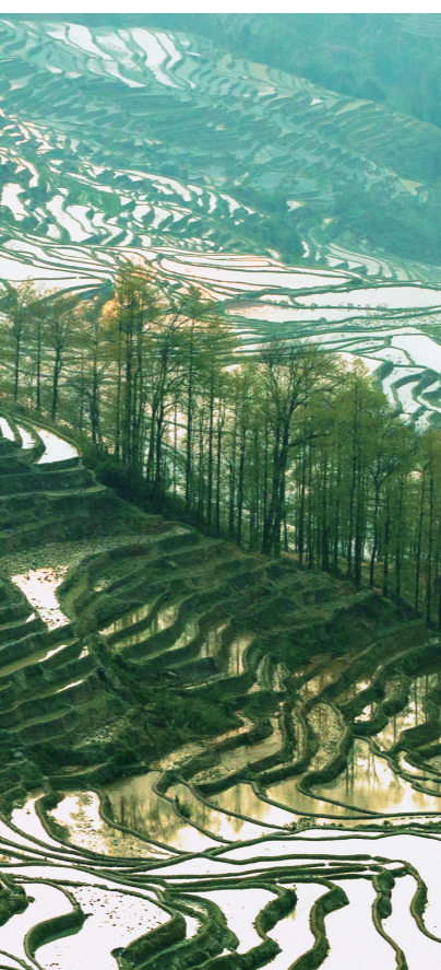
大地乐章

和老董合影后，他慢慢地把灯关掉，锁上门，和我告别。路灯下，他的身影显得有些落寞。回转身，月光落在三味书屋四个大字上，我用力想把它刻在脑海里。