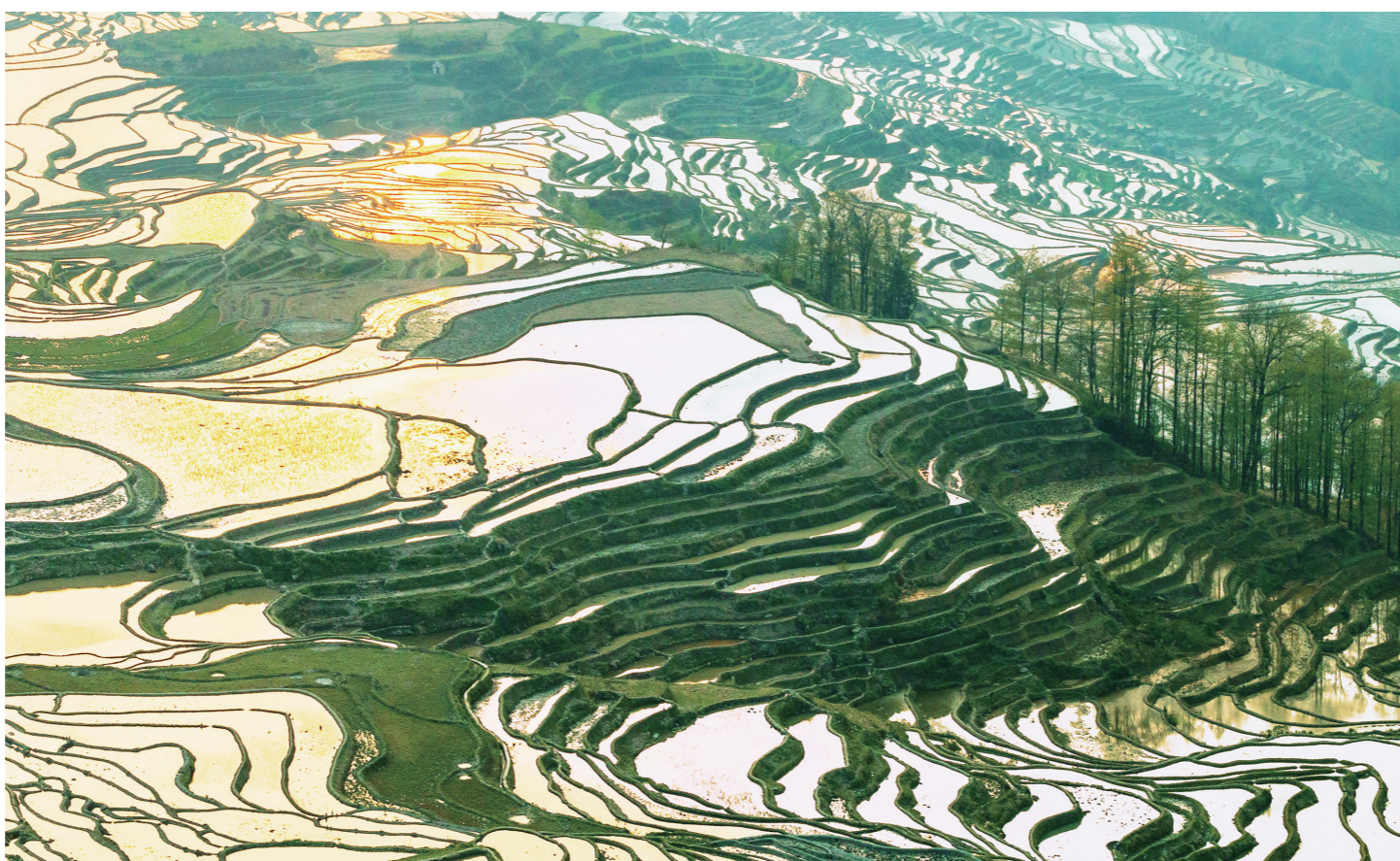
大地乐章

大学毕业，想利用闲暇时间重拾写作。于是经常去老董的三味书屋看书、买书。很多时候，我会和老董讨论自己看书的一些体会，他也会发表自己的看法。就在这