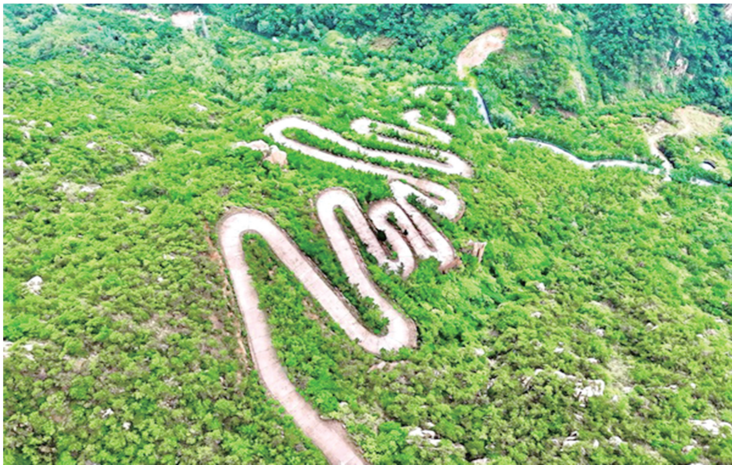
泰山波瀾

雨势渐收，天柱山在暮色中浮现，潜山城万家灯火次第亮起。倘若先生魂兮归来，望见今朝山河静好、人间烟火清宁，定会含笑颌首微笑吧！