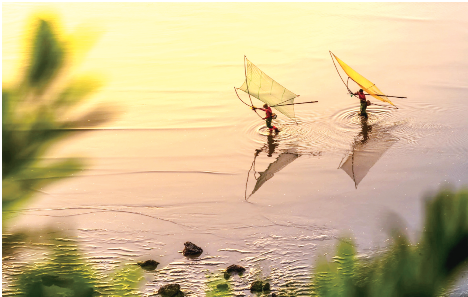
夕阳渔歌