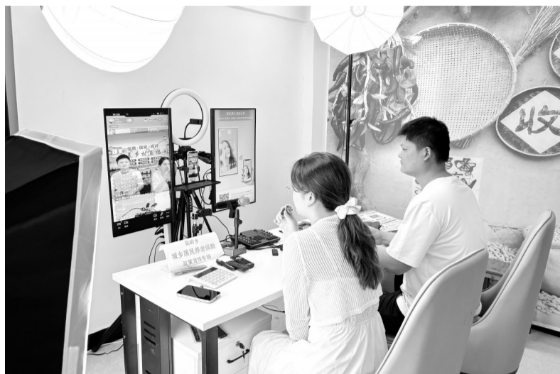
宿松县高岭乡“和美乡村直播间”直播现场。

为切实破解农产品销售难题,拓宽本土特色农产品销路,高岭乡创新直播模式,跳出固定直播间场景,深入田间地头开展实景助农直播,把镜头对准农田,让资源赋能农户。其中,该乡双河村驻村第一书记主动担当、带头出镜,以田间实景直播的方式推介本土油桃产品,有效提升产品知名度,为特色林果产业拓宽销售渠道。