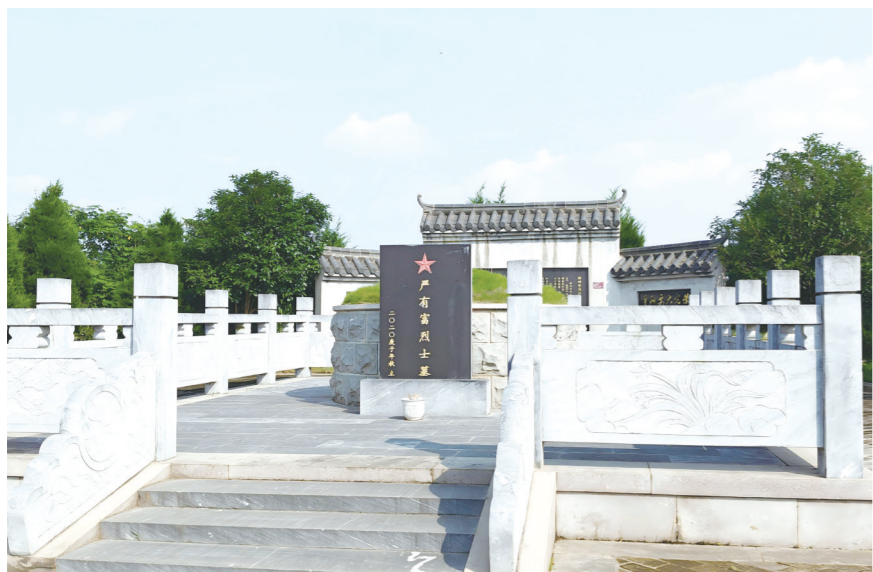
位于宿松县下仓镇先进村的严有富烈士墓。

1940年初夏，宿松湖区波浪翻滚，一场力量悬殊的生死对决，在毕家岭悄然拉开序幕。