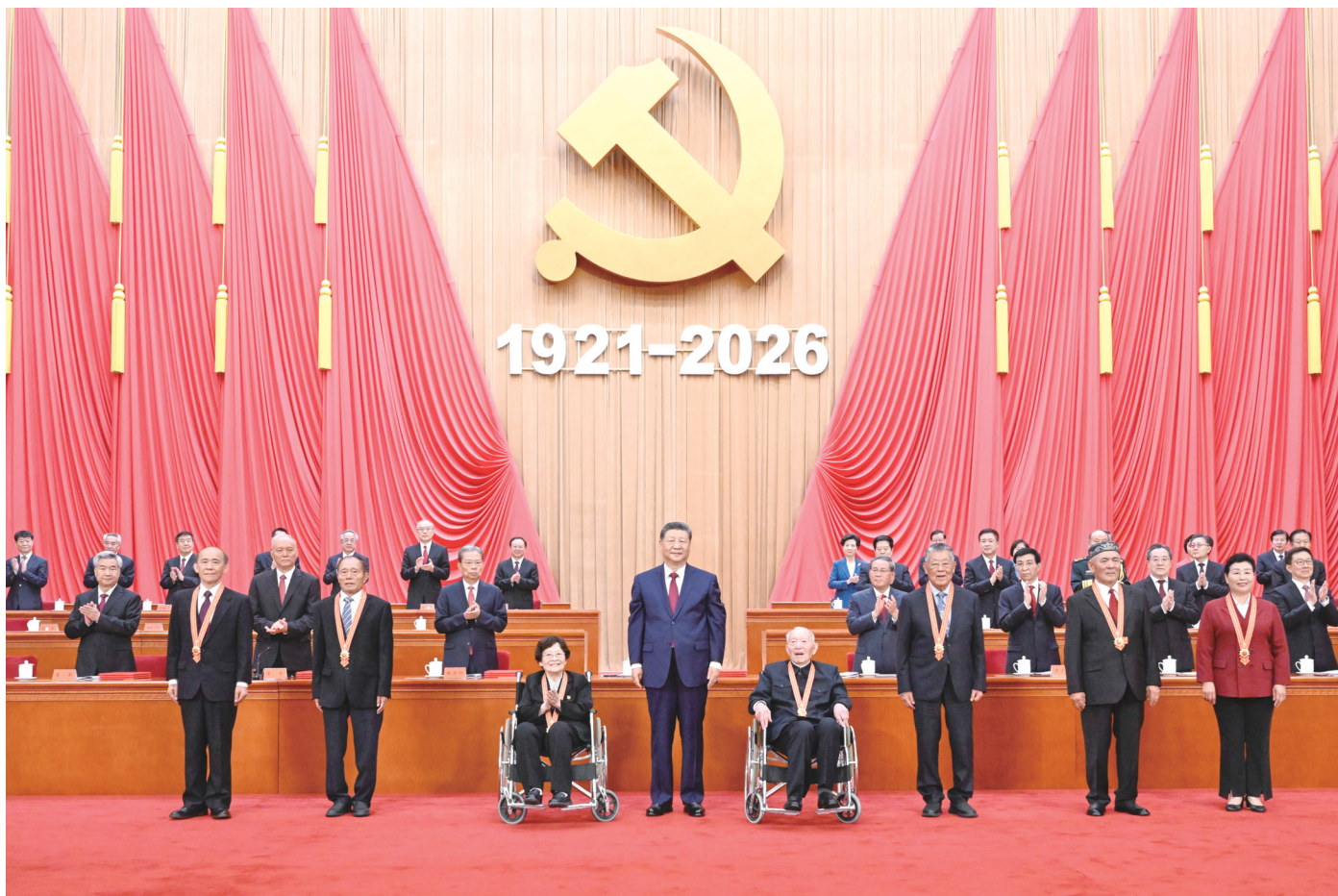
7月1日上午,庆祝中国共产党成立105周年大会在北京人民大会堂隆重举行。中共中央总书记、国家主席、中央军委主席习近平向“七一勋章”获得者颁授勋章。

新华社北京7月1日电 庆祝中国共产党成立105周年大会7月1日上午在北京人民大会堂隆重举行。中共中央总书记、国家主席、中央军委主席习近平向“七一勋章”获得者颁授勋章并发表重要讲话。他强调,105年来,我们党始终坚守为中国人民谋幸福、为中华民族谋复兴的初心使命,在不懈奋斗中创造了彪炳史册的伟大成就。新征程