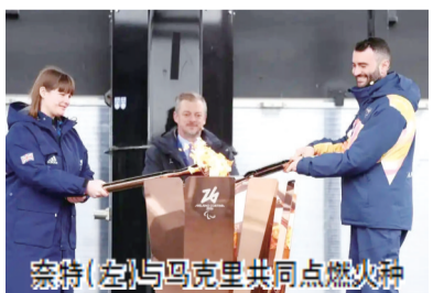
奈特(左)与马克里共同点燃火种

本次中国代表团总人数167人,其中运动员70人(男运动员51人、女运动员19人),全部为业余选手,其中62人参加过冬残奥会。运动员来自全国9个省(区市),平均年龄27岁,年龄最大的40岁、最小的18岁。这是我国参加境外冬残奥会项目最多、运动员规模最大的一届。