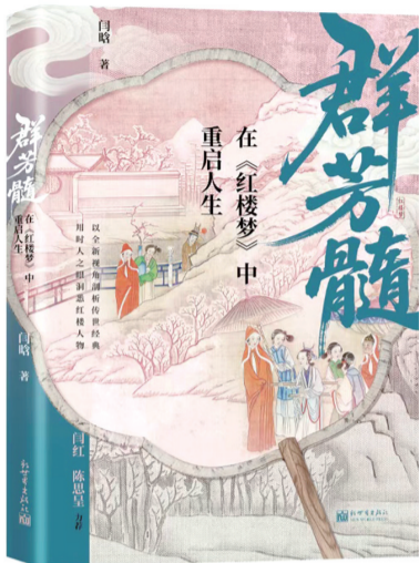
《群芳髓：在〈红楼梦〉中重启人生》