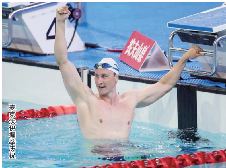
麦克沃伊握拳庆祝

2024年巴黎奥运会,麦克沃伊就曾一举拿下该项目冠军,这也是他的首枚奥运金牌。随后,在2025年的新加坡游泳世锦赛上,他同样